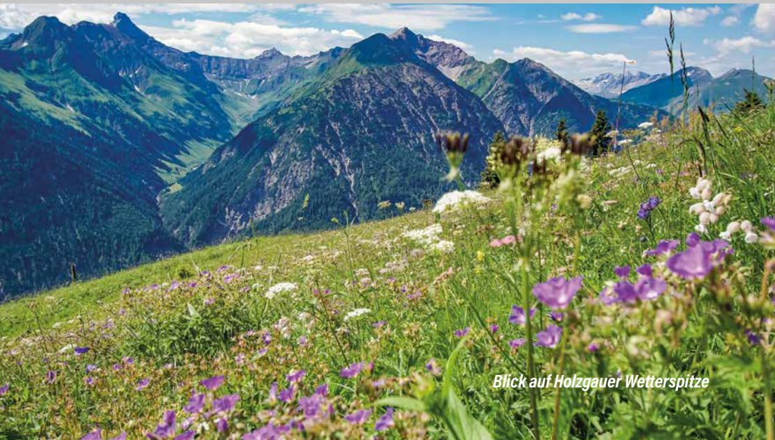
Blick auf Holzgauer Wetterspitze