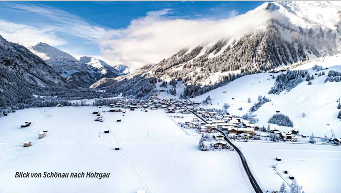
Blick von Schönau nach Holzgau